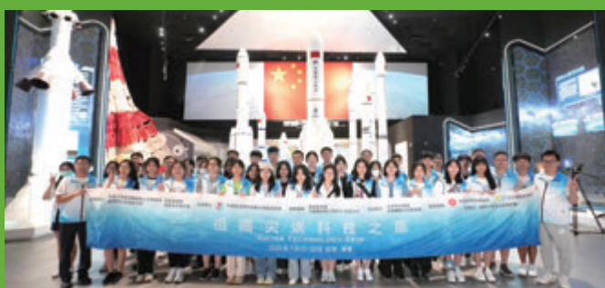
▲青年參觀北京中國航天博物館。