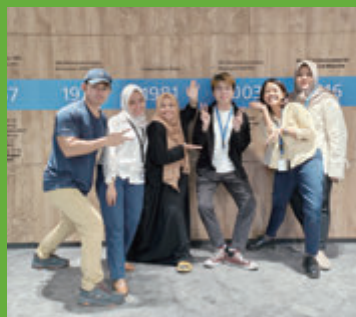
▲青年於印尼的聯合國難民署進行義務實習。

論壇的主要目標參加者為年齡介乎12至39歲的青年人，除了本地青年外，民青局亦邀請內地和海外，包括新加坡、日本、老撾、馬來西亞、菲律賓和印尼等不同國家的青年朋友來港參與，就青年關心的議題與本地青年交流和互相學習。論壇期間亦會安排各項考