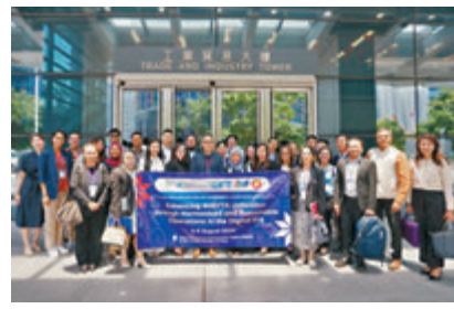
◆東盟代表團訪問工業貿易署。

商務及經濟發展局昨日在社交平台發帖介紹，有關的自貿協定載有經濟和技術合作的章節，旨在透過經濟和技術合作工作計劃提升成員的能力和提供技術支援，擴大自貿協定對成員的經濟效益。東盟代表團是次訪問是該計劃下其中一個項目的部分活動，由泰國商務部主辦。