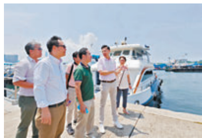
◆林智文昨日應楊永杰及梁文廣的邀請，乘坐遊船視察九龍海濱。

發展局將於今年內向立法會提交修訂《保護海港條例》草案，林智文期望《條例》盡快通過，