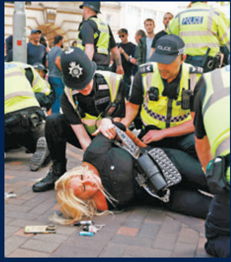
◆英警在諾丁漢拘捕示威者。

公告說，近來，英國多地多次發生騷亂和社會治安事件。中國駐英國使館再次提醒在英中國公民包括中國遊客密切關注當地治安狀況，避免前往事件發生地點。請及時注意使領館連續發布的安全提示，切實加強安全防範。如遇緊急情況，須及時報警求助並與中國駐英國使領館聯繫。