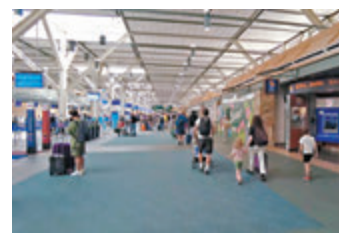
◆暑假是旅遊旺季，旅客最關注航班安排。

足夠燃料飛抵目的地。哈特維爾特表示航空公司極力避免對旅客帶來不便，但根據天氣和機場狀況，例如美國科羅拉多州丹佛國際機場，海拔達1,609米，在炎熱的夏季，貨物或乘客數量可能被迫減少。如果航空公司預計將會出現更多的極端炎熱天氣，航空公司的航線網絡和航班的臨界質量勢必受到影響。