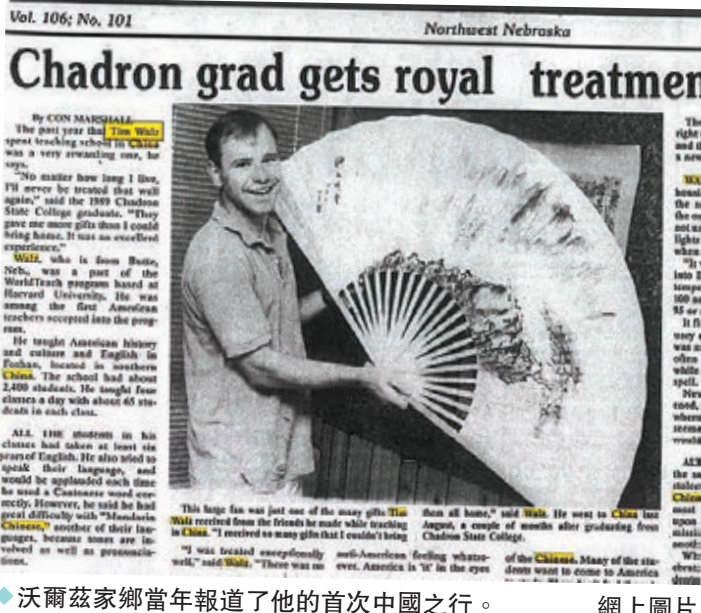
◆沃爾茲家鄉當年報了他的首次中國之行。