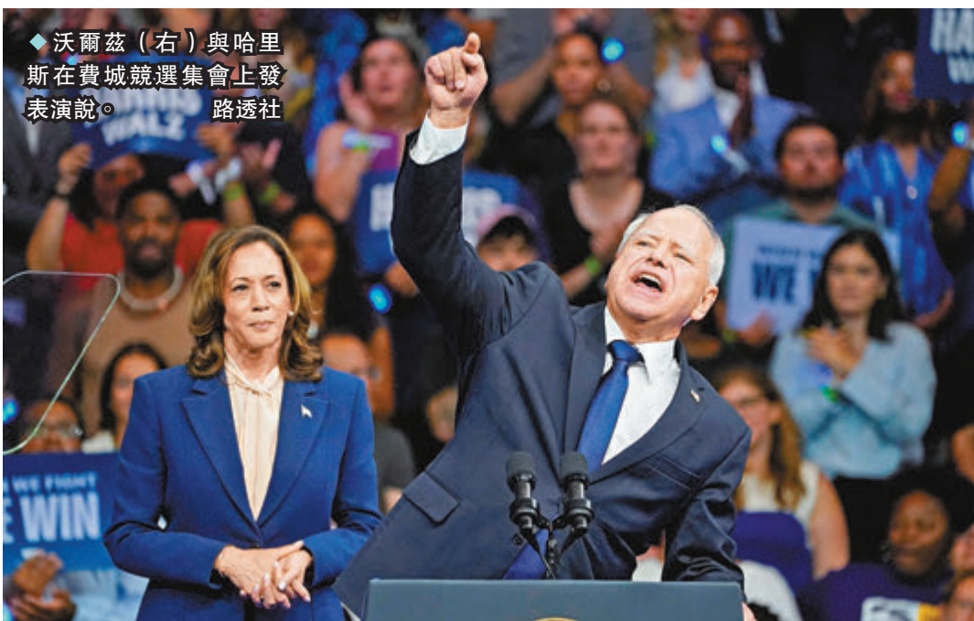
◆沃爾茲(右)與哈里斯在費城競選集會上發表演說。

美國有線新聞網絡(CNN)報道，特朗普的許多盟友都擔心，哈里斯會選擇受歡迎的賓州州長夏皮羅為副手，可能為她在這個關鍵戰場州提供優勢。這些人如今都如釋重負，一名與特朗普關係密切的消息人士表示，哈里斯決定跟沃爾茲拍檔而非夏皮羅，讓賓州「仍不知鹿死誰手」。