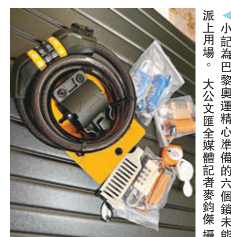
▲小記為巴黎奧運精心準備的六個鎖未能派上用場。

由出發前的如臨大敵，到現在能悠然自得地在巴黎街頭漫步，17天的奧運之旅令小記對巴黎大大改觀。不過和當地記者聊天時，對方告訴我巴黎的安定祥和只是奧運限定，他笑稱一輩子也沒試過在巴黎見到這麼多警察。巴黎有多浪漫目前還沒感受到，不過奧運期間的巴黎的確令人安心。