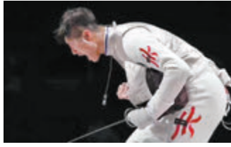
◆運動員歷盡艱辛，全身心努力鑽研多年，有幸獲得好成績，不論民族、國籍、膚色，我們都應同聲讚好，予以支持及鼓勵。

中間隔着40年，從許海峰到潘展樂，從第一面金牌，到打破超過一個世紀幾乎絕對性以白人壟斷的賽事中，獲得金牌，更是以超出世