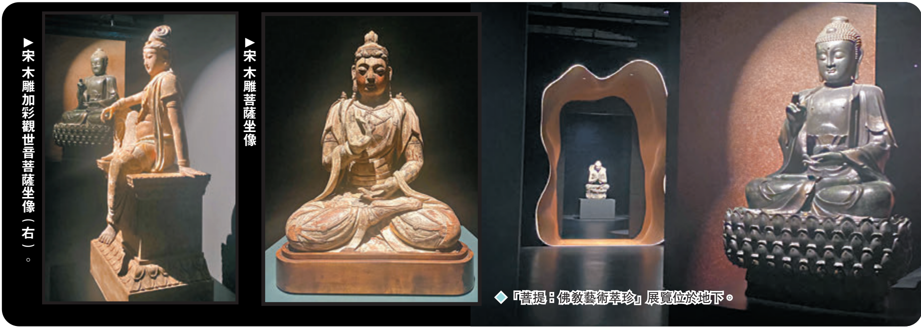
◆「菩提：佛教藝術萃珍」展覽位於地下。

7月27日，蘇富比位於置地遮打的旗艦藝廊揭幕，展出逾百件珍稀名品。地下設有博物館級展覽空間，可為觀眾帶來沉浸式觀賞體驗；一樓則是Sotheby's Salon，旨在提供涵蓋近20個門類的藝術品零售。從佛教造像的精妙展現，到跨越千年的