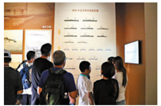
◆觀眾在山東博物館觀展。