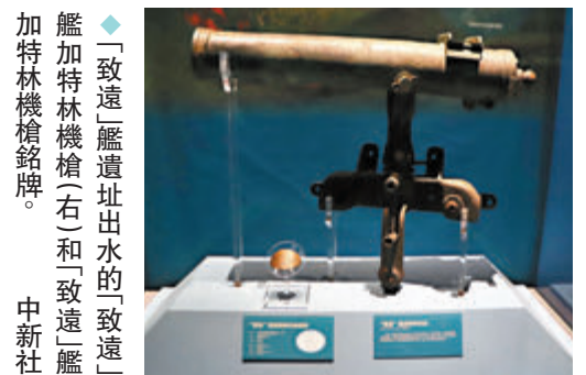
◆「致遠」艦遺址出水的「致遠」艦加特林機槍。