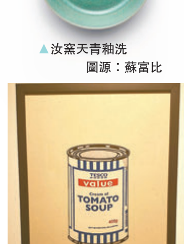
▲汝窯天青釉洗