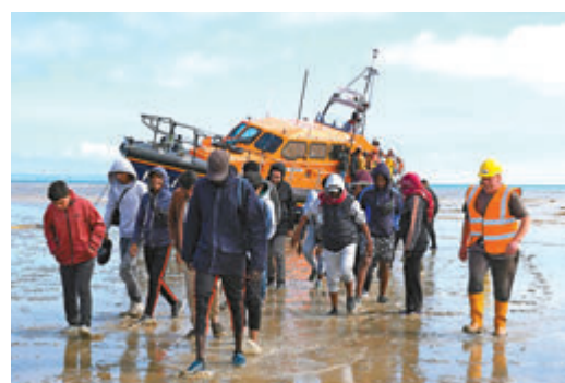
◆有港人將自己代入白人身份，反對接納難民。網上圖片

到英國買樓租樓，早已拉高了不少地區的樓價租金，變相就是另類侵蝕社會資源，說不定那些極右白人某一天會覺得自己買不起樓租不了屋，就是移英港人之過，搞一場反移英港人騷亂，這些事有誰敢說不會發生？