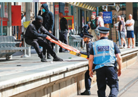
◆溫小姐指白人反移民為名到處趁火打劫。