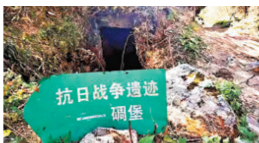
遠征軍高黎貢山抗戰碉堡遺址。

高黎貢山也是我國西南的邊防戰略屏障。幽幽古道邊還保存有斷碣殘碑、明礮暗堡，以及烽火台和戰坑戰壕等各種古今戰爭遺蹟。特別是上世紀三四十年的抗日戰爭時期，高黎貢山曾經是滇西抗戰的主戰場。1942年5月，隨著中國遠征軍在緬甸戰場失利，侵華日軍佔領騰沖等地，進而佔據高黎貢山進犯保山、瀘水等地。1944年6月，中國遠征軍轉入大反攻，從怒江西岸強渡怒江，向日軍高黎貢山陣地發起衝擊，在南北齊公房地區展開激戰。北齊公房地區的戰鬥尤為慘烈，中國遠征軍第54軍主力第198師向北齊公房日軍據點發起猛攻，日