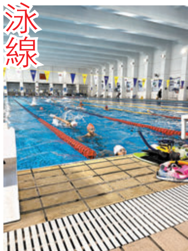
◆女飛魚何詩蓓在奧運再奪兩枚銅牌後，點燃家長對子女學習游泳的熱情。

特區政府康文署在回覆香港文匯報查詢時表示，為平衡一般市民及不同團體使用泳池的需要，根據計劃現時就主池泳線的分配監管機制，各體育總會的屬會每小時最多可獲分配兩條泳線，每日最多獲分配六條泳線；七月至八月期間，體育總會的屬會每日最多獲分配八條泳線。署方一直致力推廣「普及體育」，並透過轄下18區分區康樂事務辦事處及各體育組別舉辦多元化康樂體育活動。