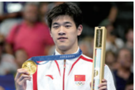
潘展樂 游泳-男子 100米自由泳