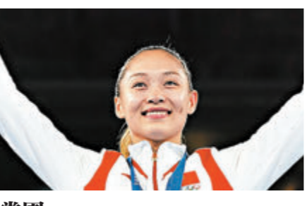
常園 拳擊-女子 54公斤級