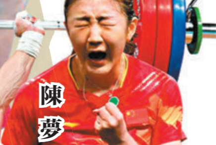
曹緣 跳水-男子 10米跳台