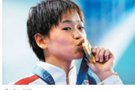
全紅嬋 跳水-女子 10米跳台