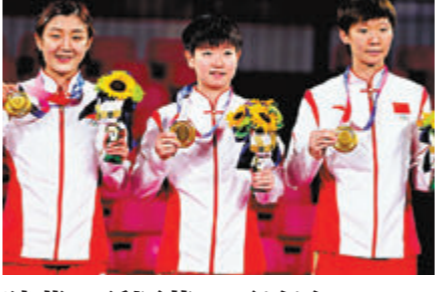
陳夢 / 孫穎莎 / 王曼昱 乒乓球-女子團體