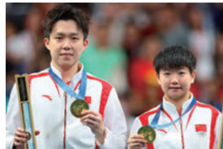
王楚欽 / 孫穎莎 乒乓球-混合雙打