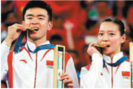
鄭思維 / 黃雅瓊 羽毛球-混合雙打