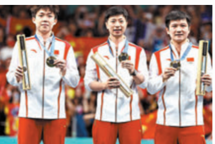
王楚欽 / 馬龍 / 樊振東 乒乓球-男子團體