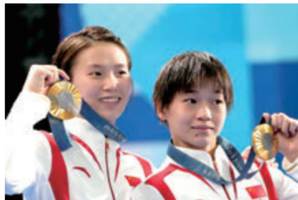
陳芋汐 / 全紅嬋 跳水-女子雙人 10米跳台