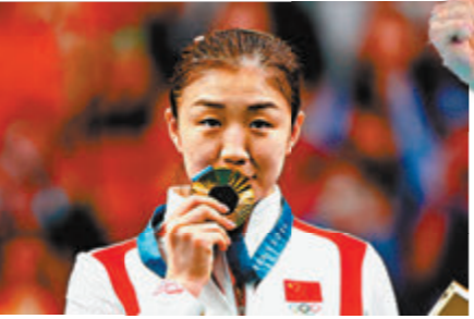
陳夢 乒乓球-女子單打