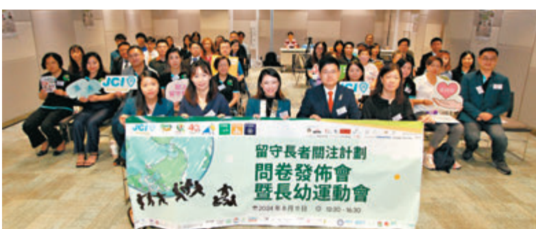
◆香港留守長者之現況與需求問卷調查結果發布會。