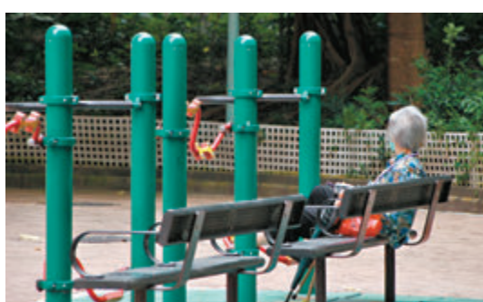
◆逾半受訪者認為自身精神健康狀況差至一般。