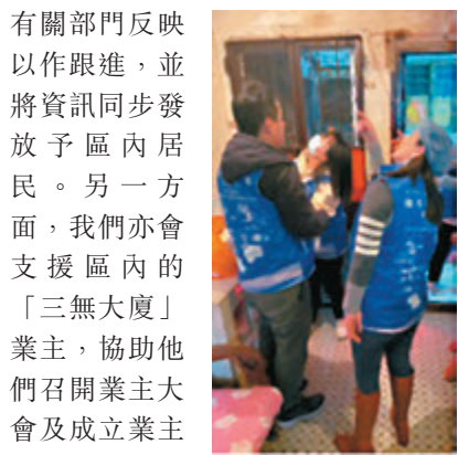
◆隊員上門了解婆婆單位天花滲水的情況。

未來，我們將繼續關注區內獨居長者和雙老家庭的個案，提供各類貼心周到的關愛服務。我們也積極招募更多熱心服務社區的義工加入，共同為油尖旺區注入正能量。