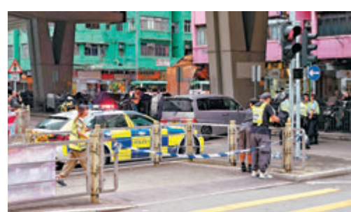
◆逃避警方截查的毒品車在大角咀道及福全街交界失控撞欄。

結果在車上再檢獲共重約1,156克的懷疑氫胺酮、少量懷疑可卡因及一批懷疑吸食工具，總值逾57萬元。