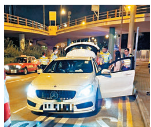
◆警方一連三天在東九龍打擊酒後駕駛事項，共拘捕5男1女司機。