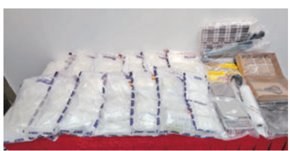
◆警方在長沙灣一高級私人屋苑偵破毒品儲存倉，檢獲毒品總值1,850萬元。

銷角色，將毒品分拆重新包裝然後出售。至於涉案單位面積約450呎，販毒集團於8個月至9個月前以每月租金近3萬元租下，其目的是要利用屋苑人流少及高設防的特性，逃避警方追查。