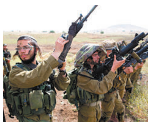
◆「耶胡達勝利營」被指控侵犯巴勒斯坦民眾人權，毆打槍殺平民。