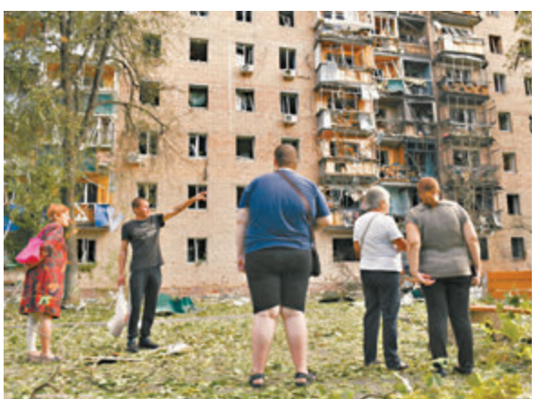
◆庫爾斯克州有民居受損，當地7.6萬人疏散。

在俄烏衝突持續之際，白俄羅斯總統盧卡申科在上週六的內閣會議中，指控烏軍無人機曾入侵白俄領空，違反所有協議及行為規則，白俄空軍防空部隊已進入最高的一級全面備戰狀態，並擊落多架無人機。白俄外交部則召見烏駐當地臨時代辦，要求烏方採取措施阻止類似事件再發生，並警告白俄有權採取進一步措施保護自身領土安全。