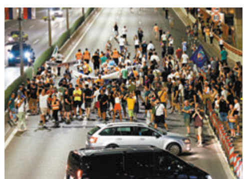
◆抗議活動被指是出於「政治動機」。

舉產生的政府，發起顛覆性行動，破壞塞爾維亞國家穩定，目的是使局勢升級並走向失控。