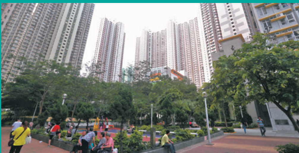
◆房委會相信公屋平均輪候時間今年下半年會維持平穩。圖為屋邨居民生活情況。資料圖片

香港住屋問題正在逐漸改善，香港房屋委員會昨日公布，截至今年6月底，過去12個月獲安排入住公屋的一般申請者，平均輪候時間5.5年，較上季縮短0.2年，當中長者一人申請者的平均輪候時間亦縮短0.1年，平均輪候為3.7年。房委會解釋，受惠於公屋提前上樓計劃下的長青邨和業旺邨分階段提早落成，加上入住新界區公屋申請者的平均輪候時間相對較短，有助消化公屋申請。未來陸續有新公屋項目落成、多個居屋計劃和綠置計劃項目入伙，房委會相信公屋平均輪候時間今年下半年會維持平穩，甚至輕微下調，有信心公屋綜合輪候時間在2026/27年度將回到平均輪候約4.5年的目標。◆香港文匯報記者 王偉