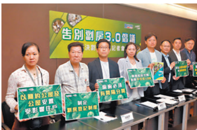
◆民建聯昨日舉行告別劏房3.0倡議記者會。

「支持政府取締劣質劏房，始終空間狹窄和焗熱，子女都無空間做功課和玩樂。」一家四口居於不足100呎劏房的陳小姐表示，居住環境欠佳