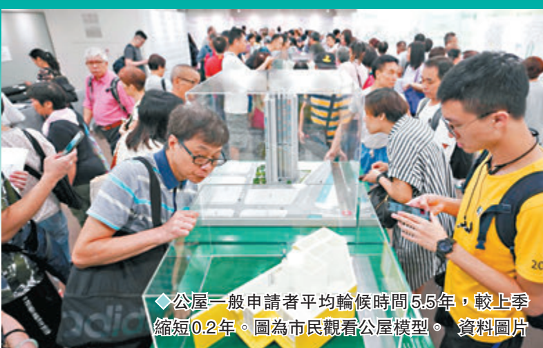
◆公屋一般申請者平均輪候時間5.5年，較上季縮短0.2年。圖為市民觀看公屋模型。資料圖片