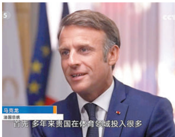
◆馬克龍接受央視總台專訪。