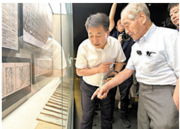
◆清水英男參觀侵華日軍第731部隊罪證陳列館。

香港文匯報訊 據新華社報道，侵華日軍第七三一部隊原隊員、94歲的清水英男一行13日來到位於哈爾濱的731部隊罪證陳列館、731部隊舊址指認731部隊罪行。中國外交部發言人林劍當日表示，中方讚賞清水英男揭露和直面歷史真相的勇氣，日方應認真傾聽國內外正義呼聲，正確認識並深刻反省日本軍國主義侵略歷史。