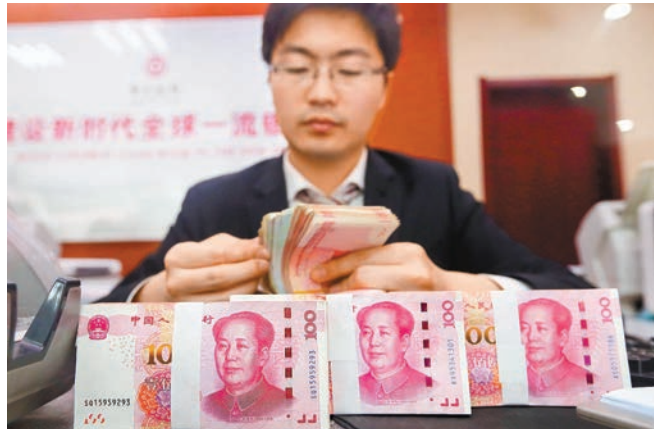
◆今年1月至7月社會融資規模增量為18.87萬億元，同比减少3.22萬億元。