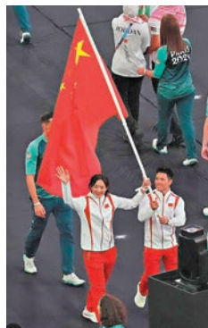
支持你們！4年後再見！加油！

了寶貴的內容！看各個電子傳媒拚搏，我也跟着他們轉，其中鳳凰衛視、HOY TV、港台、TVB、ViuTV我是輪流看，家中人不多，所以沒有出現爭着與奧運節目的情況，不過長者還是有話語權，他特別喜歡HOY TV，我則愛鳳凰衛視較多！而其他兄弟姐妹好友則在群裏爭相報道各類目的項目，真是難得的17天賽事、難得的好機會！