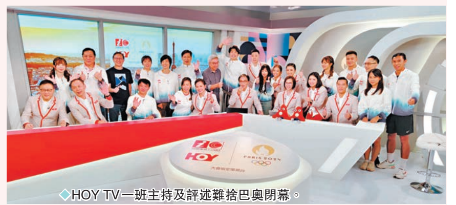
HOY TV一班主持及評述難捨巴黎閉幕。