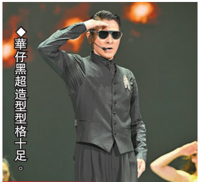
華仔黑超造型格十足。

香港文匯報訊(記者 阿祖) 劉德華36場《今天 is the day 巡迴演唱會2024》內地站，由7月上海站啟程至前日成都站，華仔夾着汗水和歡呼聲下，已順利完成了22場演出，多得fans的正能量，讓他體能充沛，笑言相信70歲仍可站在台上跟大家見面。