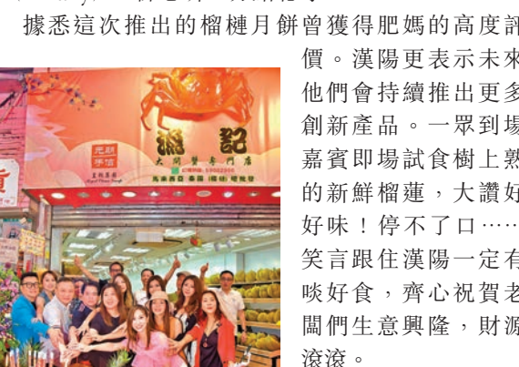
漢陽與一班好友齊切燒豬，賀新店開張。

香港文匯報訊 歌手漢陽繼之前與朋友合資開餐廳後，籌備半年多再下一城，與飲食界好友合作，推出全新的榴槤系列產品，經過半年的精心籌備，日前於銅鑼灣街市正式開業，一向在圈中人緣甚廣的漢陽更獲得一班藝人好友到場祝賀，包括范振鋒、譚嘉荃、陳蕊蕊、文恩澄、梁凱璇、林鈺偉、小婷(Tiffany)、陳思圻、方紹聰等。