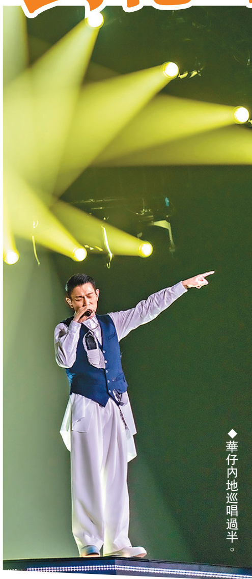
華仔內地巡唱過半。

難得一次過在不同地方跟fans在演唱會中見面，華仔珍惜地說：「大家能夠有這些機會相聚，特別珍惜。明白到fans對自己的愛惜，大家應該用享受的心情去睇演唱會，乖乖地坐在自己座位上舉起雙手舞動一下，那就最好了，順便當做運動。」