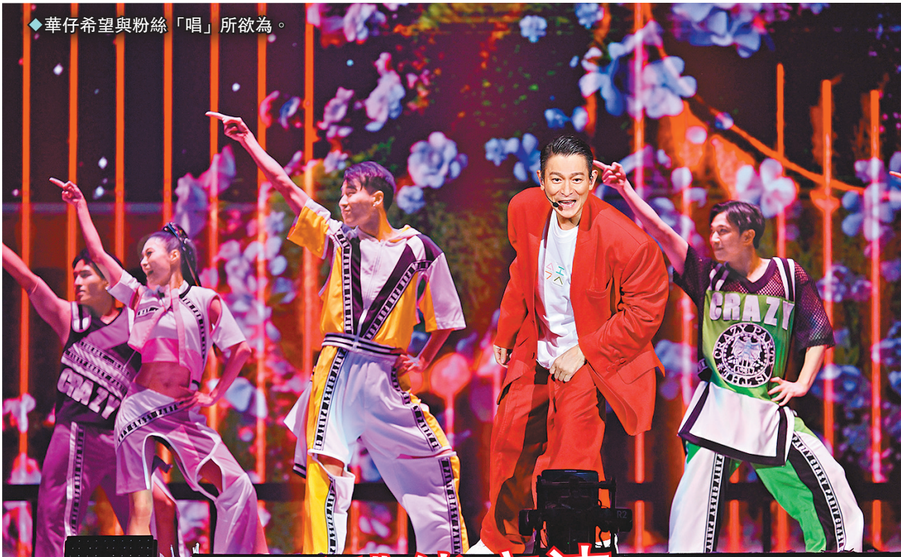
華仔希望與粉絲「唱」所欲為。