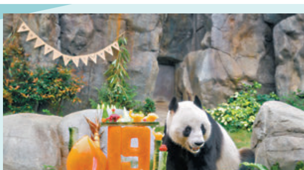
▶樂樂與生日蛋糕。

香港海洋公園的大熊貓盈盈、樂樂，分別於2005年8月16日及8月8日出生。早前，海洋公園為盈盈和樂樂舉行生日派對，護理員為牠們送上色彩鮮艷的冰蛋糕。創意十足的設計不單展示兩位壽星的歲數，材料更用上牠們最愛吃的竹子、甘薯、胡蘿蔔、沙葛和蘋果，慶祝兩位「8月之星」踏入19歲。