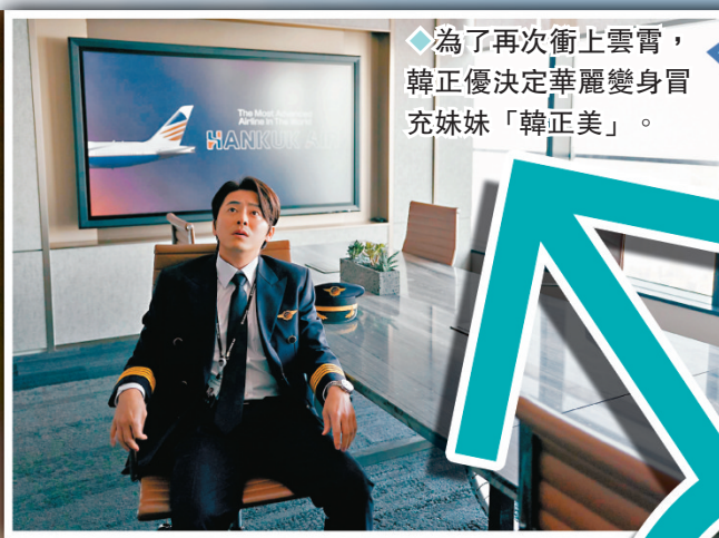
◆為了再次衝上雲霄，韓正優決定華麗變身冒充妹妹「韓正美」。