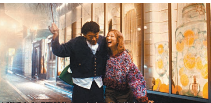
◆鄭秀文與「黑川先生」在凌晨東京撐傘漫步。