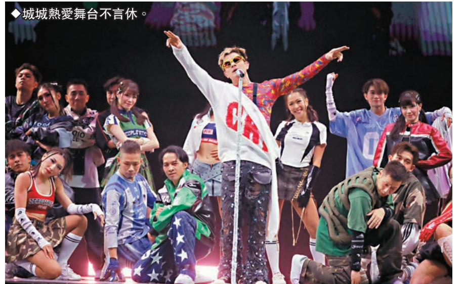
◆城城熱愛舞台不言休。