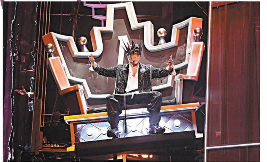
◆城城化身國王 空降「AK (Aaron Kwok) 城堡」。

城城緊接展示了30幅自創的「您」字書法，演唱特意为歌迷創作的歌曲《您》，他說：「每一幅字畫中的『您』代表1年，這些代表着我對每位歌迷在這30年中的紀念和印記，希望永遠留在我心裏及工作室中，當有日見不到大家，無法再在舞台上表演，我會看這些字畫來感受，這些都是我美好的回憶，在此衷心感謝大家給予我的支持。」說時城城感觸萬分，強忍淚水，亦誠如他前所言，要為大家帶來歡樂，因此做好情緒管理，與大家在一派歡樂中完成當晚的演出。