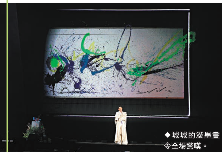
◆城城的潑墨畫 令全場驚嘆。