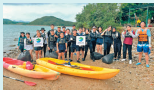
◆三地青年划艇於黃宜洲附近海岸清理垃圾，認識生態。

粵港澳「全國生態日—香港站」由粵港澳大灣區香港社會服務專業聯盟與廣州法澤社區公益基金會主辦，香港中華基督教青年會和廣州市海洋雙碳研究會協辦。今年活動以由認識至保護大自然為主題。