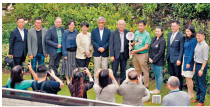
◆賽馬會善寧之家《福善花園·蝴蝶園》開幕典禮。

香港文匯報訊（記者 吳健怡）由非牟利組織善寧會營運的賽馬會善寧之家，為臨終病人建設一個蝴蝶生態園，綠樹成蔭、鮮花遍地的環境，吸引超過20種蝴蝶翩跹起舞。善寧會昨日藉着「全國生態日」舉辦開幕典禮。蝴蝶象徵着生命的蛻變和重生，為晚期病人及其親友帶來喜悅和希望，期望生態蝴蝶園可以陪伴院友度過生命最後一段路程，意義重大。