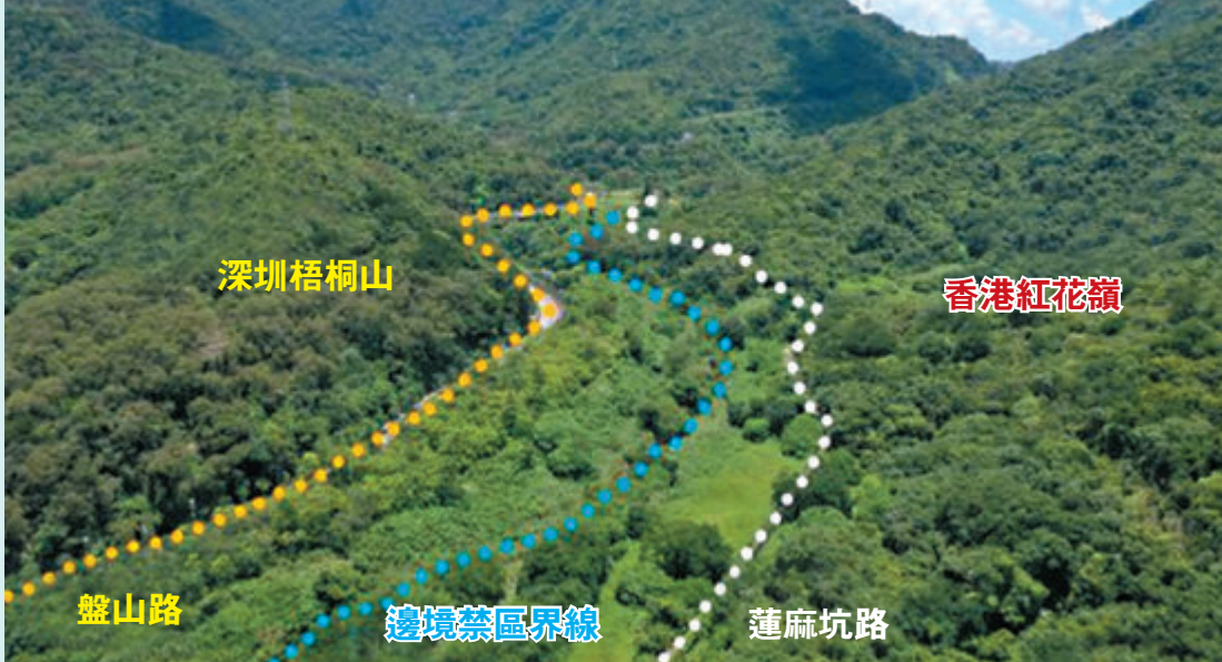
◆紅花嶺與梧桐山將打造貫穿港深兩地的生態廊道。