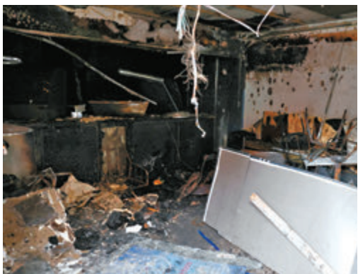
◆貝爾法斯特有咖啡室被極右暴徒燒毀。

英媒報道香港未成年黑暴分子涉案時，還刻意聲稱警方「很大程度上任意拘捕青少年」，指稱「未成年人對自身權利了解甚少」。至於報道當地參與騷亂的青少年被捕，英媒則強調涉案者的辯方律師都表示，涉案者「對自身行為絕對感到羞恥」。