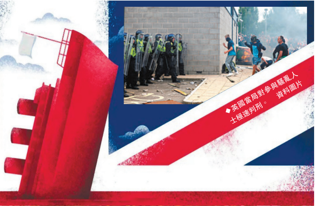
◆英國當局對參與騷亂人士極速判刑。資料圖片

香港文匯報訊 英國日前的極右反移民騷亂已有逾1,000人被捕，多間英媒都大幅報道兩名參與騷亂的12歲少年，強調他們是被定罪的最年輕騷亂者。然而在2019年香港修例風波期間，英國等西方傳媒卻故意淡化未成年黑暴分子的暴行，故意暗示他們無端被捕，企圖將法院有理有據的裁決形容作不公待遇，無疑盡顯雙標。