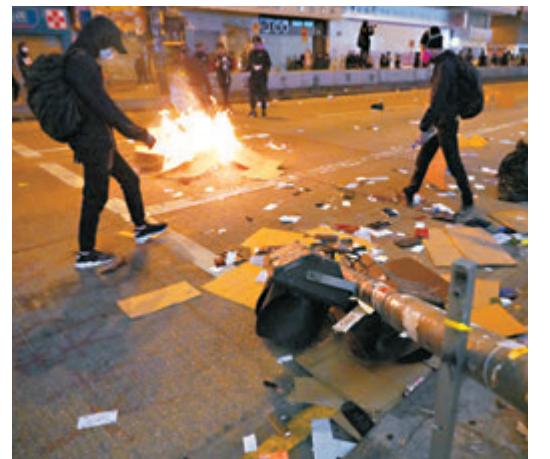
◆香港黑暴分子被英媒美化作所謂「犧牲自己」。

至於參與修例風波的未成年黑暴分子，在英媒《衛報》報道中，居然成為所謂「爭取民主和自由的鬥士」。其中一名12歲黑暴分子在騷亂中，公然襲警，強調他「不相信警察伸張正義」。報道卻形容他的做法源自所謂「滿懷『拯救香港』的熱情」，為他的行為辯護。