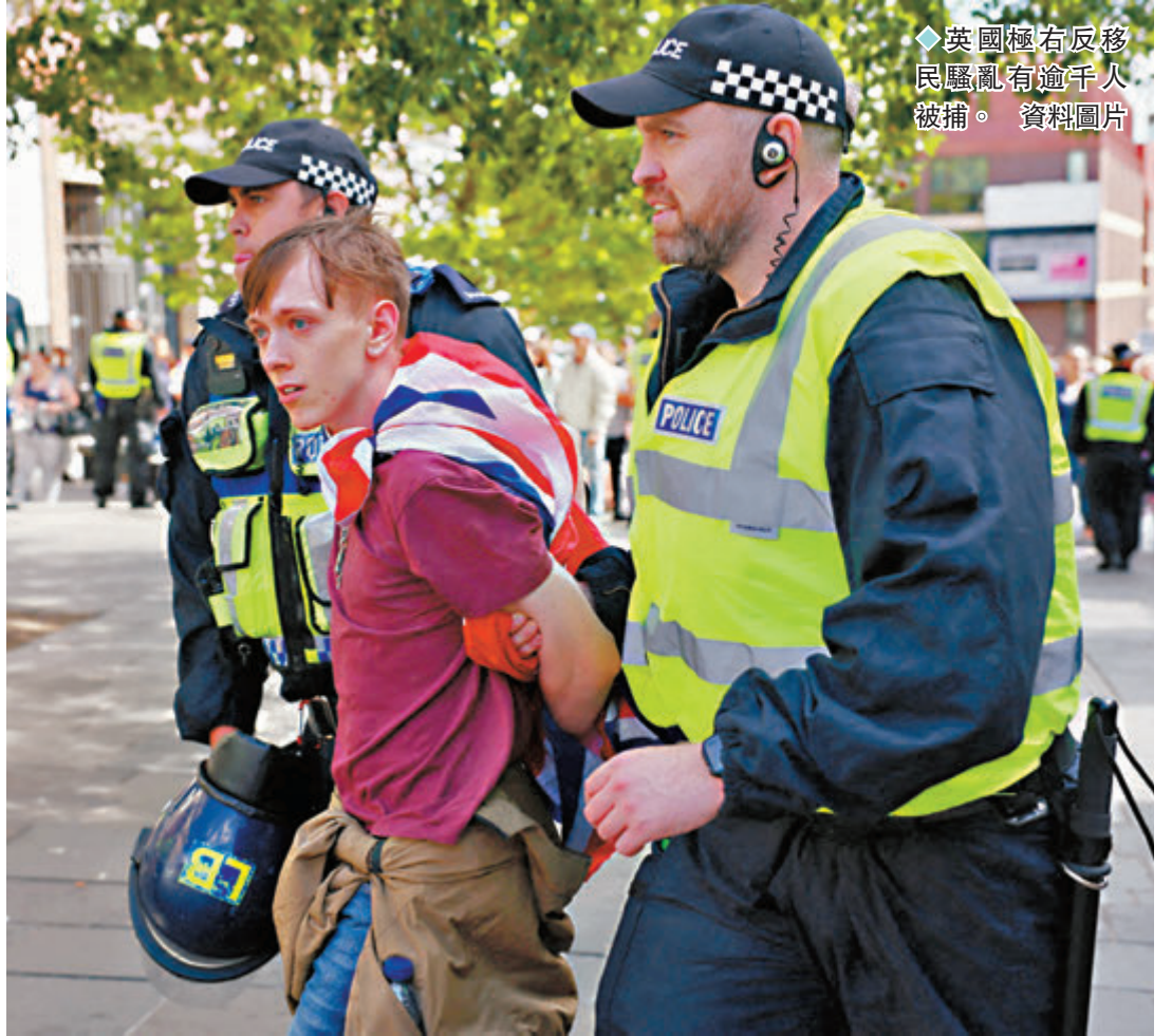
◆英國極右反移民騷亂有逾千人被捕。資料圖片

英國樓市困境近年浮面，相較1997年樓市均價是居民平均年收入3倍水平，現時英國樓市均價已攀升至居民年收入約6倍。哈弗德稱，對於普通打工仔，「上車」需要的財富愈來愈多，「這是收入統計無法體現的不平等情緒來源。」