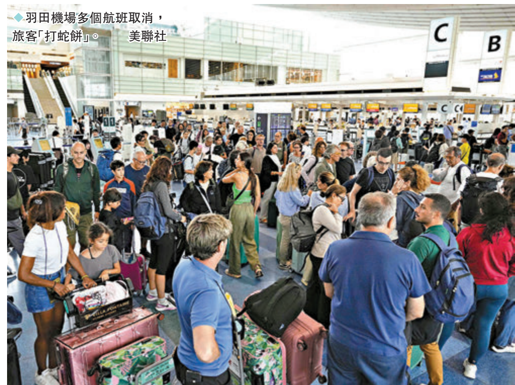
◆羽田機場多個航班取消，旅客「打蛇餅」。

香港文匯報訊 強颱風「安比」周五(8月16日)接近日本關東地區，預計周末在當地颶起強降雨。東京都附近千葉縣周五中午進入暴風圈範圍，雨勢及風勢迅速增強。颱風導致關東地區交通普遍受阻，大量新幹線列車停駛，從東京羽田及成田機場出發近1,000個日本境內及國際航班均被取消。東京電力公司統計截至周五晚間，關東地區約有3,500戶家庭停電。