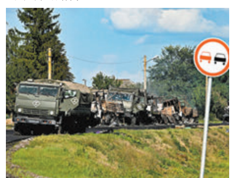
◆烏宣布佔領俄庫爾斯克州城鎮蘇瓦，圖為當地俄報廢軍車。

克地區，烏武裝部隊總司令赫爾斯基稱，烏軍現時已控制俄羅斯1,150平方公里領土，以及82個定居點。報道指出，烏軍若持續從搖搖欲墜的烏東前線調集武器和部隊，將是「可能令烏東局勢更為不利的賭博」。