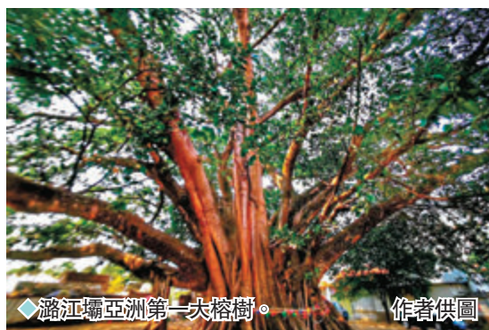
潞江壩亞洲第一大榕樹。

路——南方絲綢古道，貫穿東西，成就了南方絲綢之路的輝煌。古道從潞江壩攀上高黎貢山南部的山頂，山頂上曾設分水嶺關，也築門洞城堡，城門洞海拔約2,561米。因為古道經過的城門洞和大風口兩地，海拔均在2,500米以上，為古道最高控制點，故此道被稱為「城門洞古道」或「大風口古道」。城門洞古道自東向西，東起永昌古城，向西南分南北兩路過怒江。