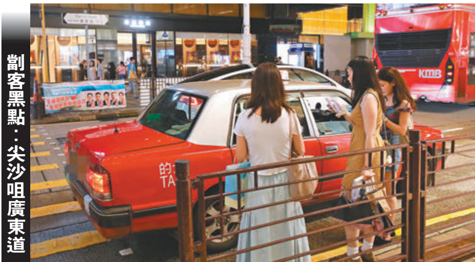
割客黑點：尖沙咀廣東道