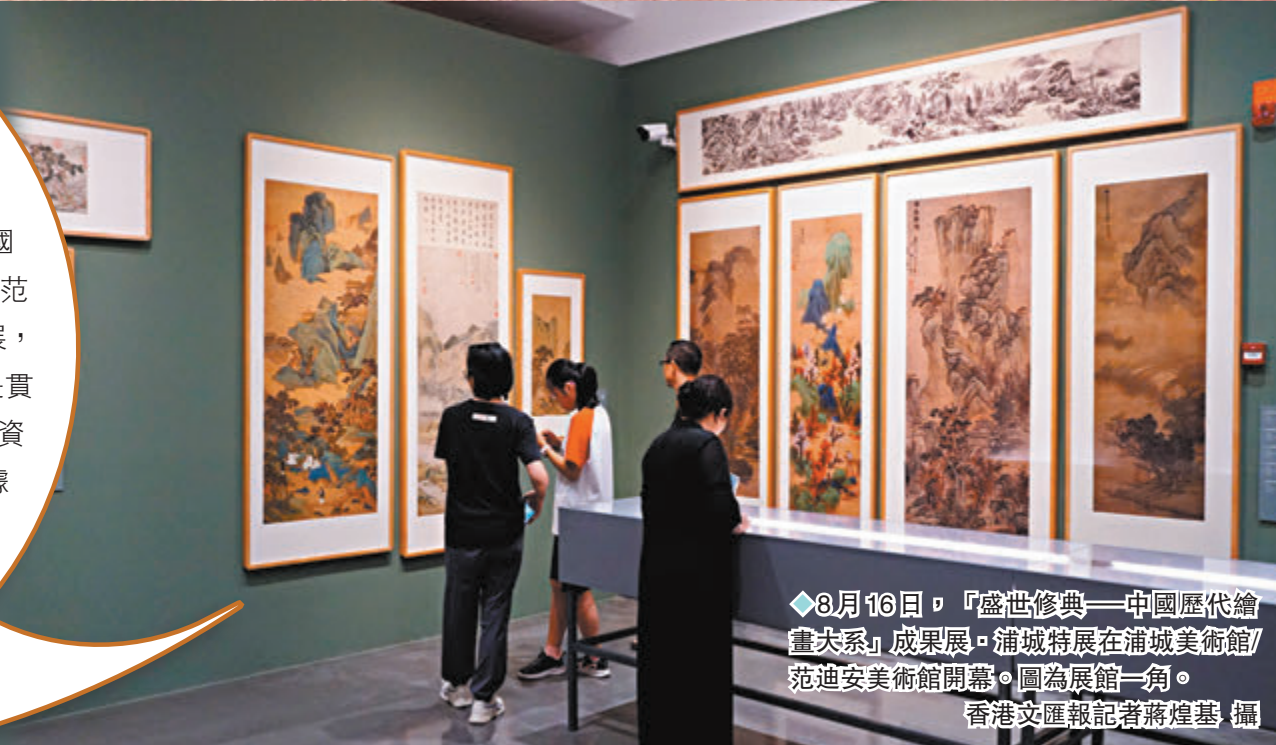
◆8月16日，「盛世修典——中國歷代繪畫大系」成果展·浦城特展在浦城美術館/范迪安美術館開幕。圖為展館一角。

據主辦方提供的資料顯示，「大系」共收錄海內外263家文博機構的紙、絹(含帛、綾)、麻等材質的中國繪畫藏品12,405件(套)，是迄今為止同類出版物中精品佳作收錄最全面、出版規模最大的中國繪畫圖像文獻。是次浦城特展是「大系」在福建區域首展，也是南方區域首展。展覽總面積約2,300平方米，共分為「薪火相傳 代代守護」、「巍巍華夏 大美河山」、「海疆勝境 八閩流風」、「創新轉化 無界之境」四部分。在「巍巍華夏 大美河山」這部分展廳，能看到隋代畫家展子虔的《遊春圖》、北宋畫家郭熙的《幽谷圖》、夏珪的《風雨山水圖》，以及《清明上河圖》、《千里江山圖》等著名畫作。