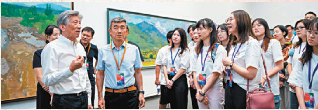
◆中國美術家協會主席范迪安(前左一)、中央美術學院教授、中國美協油畫藝委會副主任張路江(前左二)等美術界名師與學員們交流探討。