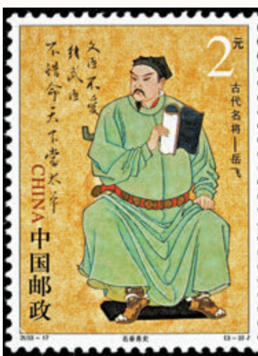
◆《古代名將—岳飛》郵票 (2003)：名垂青史