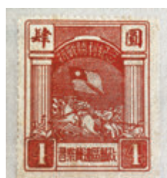
▶ 1945年中國共產黨領導的晉察冀根據地發行的紀念8·15抗戰勝利郵票。