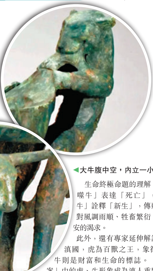
▲大牛後部有一猛虎咬住牛尾。

較為主流的說法認為，「虎噬牛」是現實世界食肉動物與食草動物之間關係的映照，反映自然界弱肉強食的規律。也有專家認為，「牛虎銅案」包含了滇人對「死亡」這一