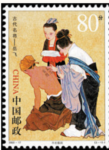
◆《古代名將—岳飛》郵票 (2003)：盡忠報國