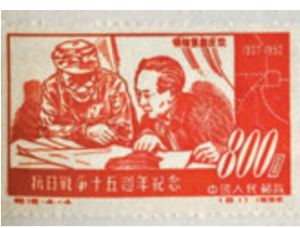
▶ 1952年，建國後中國郵政發行的第一套紀念抗戰勝利郵票。