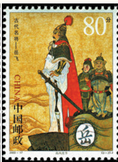
◆《古代名將—岳飛》郵票 (2003)：高風亮節