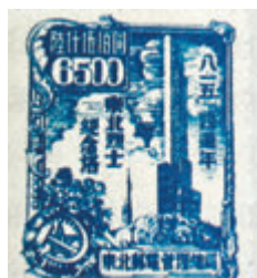
▶ 1949年建國前，東北解放區發行的8·15抗戰勝利郵票。