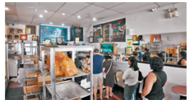
◆餐飲業人手不足，外勞需求殷切。

香港文匯報訊(特約記者成小智多倫多報導)聯合國上週發表的一份特別報告，批評加拿大臨時外勞計劃是「現代奴隸制溫床」，並指外勞普遍遭到精神和身體虐待，包括僱主剝扣工資、外勞被委派危險工作和過長工作時間、婦女遭騷擾和阻止外勞尋求醫療保健。另外，警方沒有認真處理外勞的投訴。