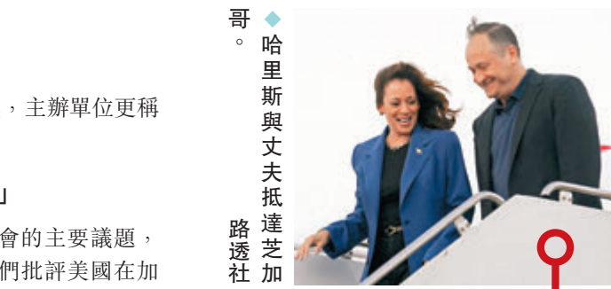
◆哈里斯與丈夫抵達芝加哥。