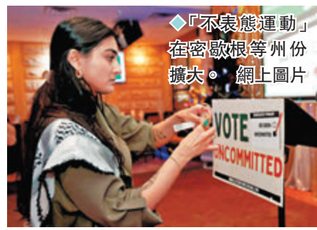
◆「不表態運動」在密歇根等州份擴大。網上圖片