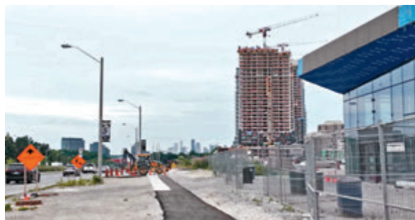
◆建築業愈來愈倚賴臨時外勞完成工程。成小智攝