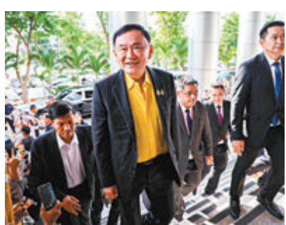
◆他信(中)出席法院聆訊。

香港文匯報訊 泰國前總理他信周一(8月19日)就冒犯君主罪指控，在曼谷法院出庭應訊。