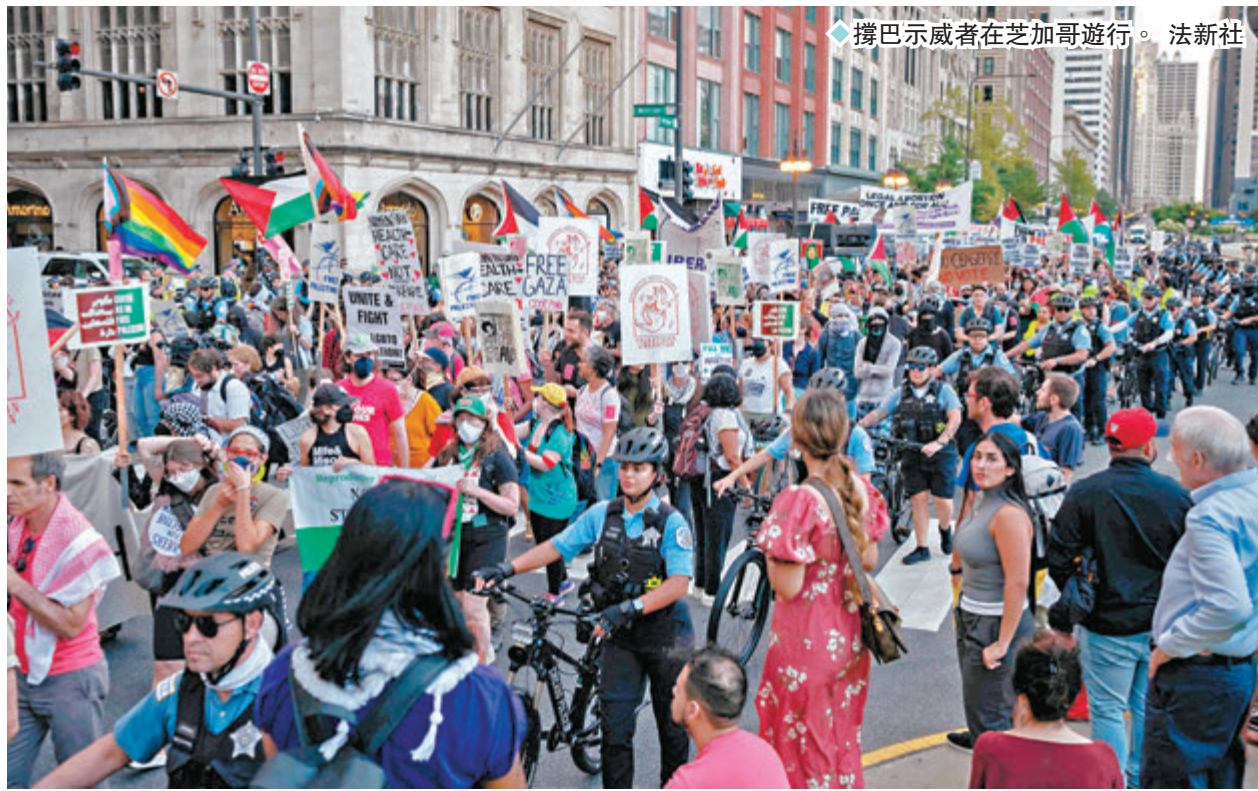
◆撐巴示威者在芝加哥遊行。

拜登定於當地時間周一晚在大會上致辭，哈里斯則會於周四接受候選人提名並發表演說，親巴黨代表的行動可能對大會程序造成干擾。