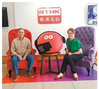
◆ 蔡導演搞舞台劇作一個新嘗試！