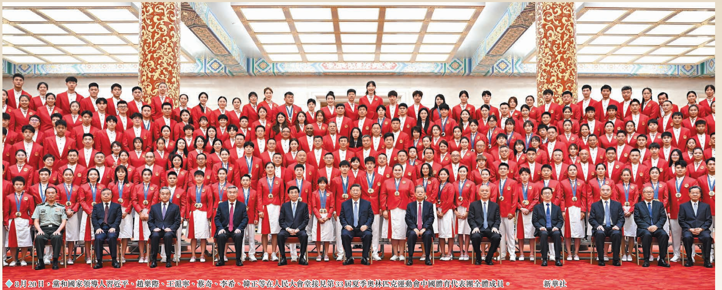
8月20日，黨和國家領導人習近平、趙樂際、王滬寧、蔡奇、李希、韓正等在人民大會堂接見第33屆夏季奧林匹克運動會中國體育代表團全體成員。