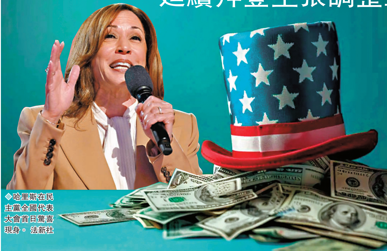
◆哈里斯在民主黨全國代表大會首日驚喜現身。

香港文匯報訊 美國民主黨總統候選人哈里斯的競選團隊周一(8月19日)表示，哈里斯若當選總統，她計劃將企業稅率提高至28%，藉以增加政府收入，協助填補向基層和中產階級大規模減稅的資金需要。英國《金融時報》指出，哈里斯這項建議勢招致商界強烈反對。