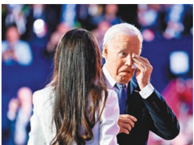
◆拜登一時感觸落下落淚。

拜登憶述在他宣誓就職前，國會遭特朗普支持者佔領，「我當時深知，現在也了解，美國絕對不容政治暴力的存在。」他強調特朗普勝選可能破壞「民主」，「你不能只有在勝選時，才愛你的國家」。拜登強調讓哈里斯接棒，是他職業生涯做過最佳的決定。