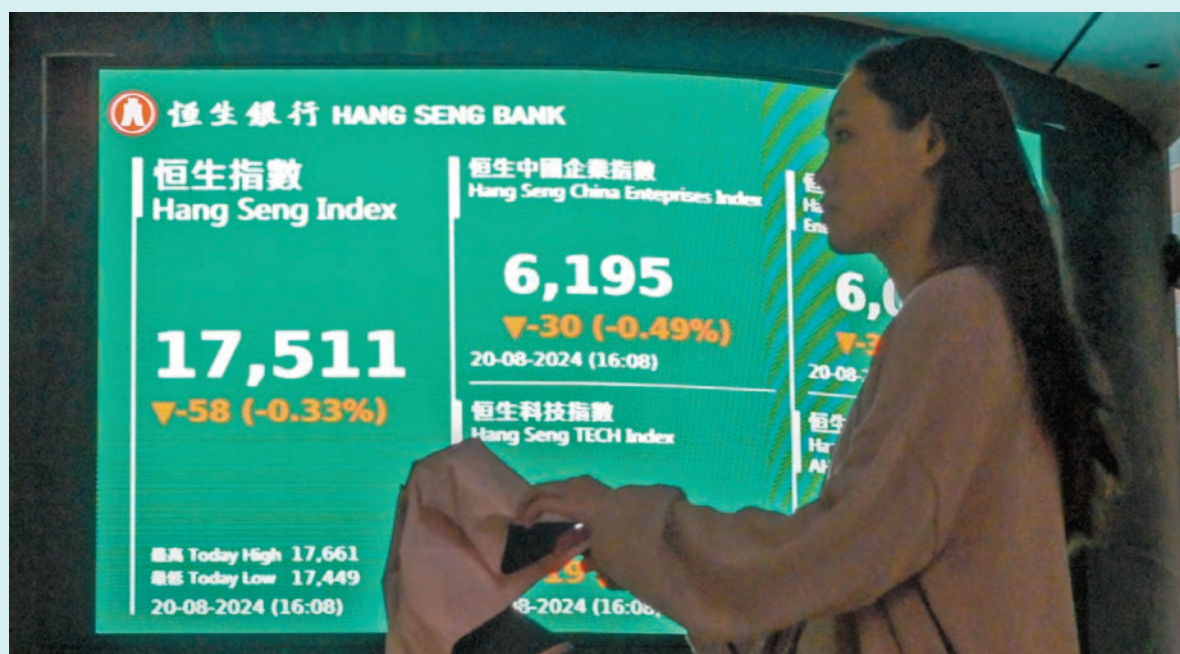
◆恒指公司表示，港股主板今年已有205間公司回購股份。圖為恒指昨日收市報價。

另外，特步（1368）半年純利及派息齊增加，股價逆市升4.5%。西部水泥（2233）中期純利減27%，全日插水11.9%。極兔速遞（1519）續後股價先升後挫5.9%。富瑞指，極兔速遞續後股價表現波動，主要由於其收入雖好過富瑞預期，但與市場預期則有差距，但經調整盈利表現則好過預期，富瑞仍維持對該股「買入」評級，但將目標價削4.4%，由9元降至8.6元。