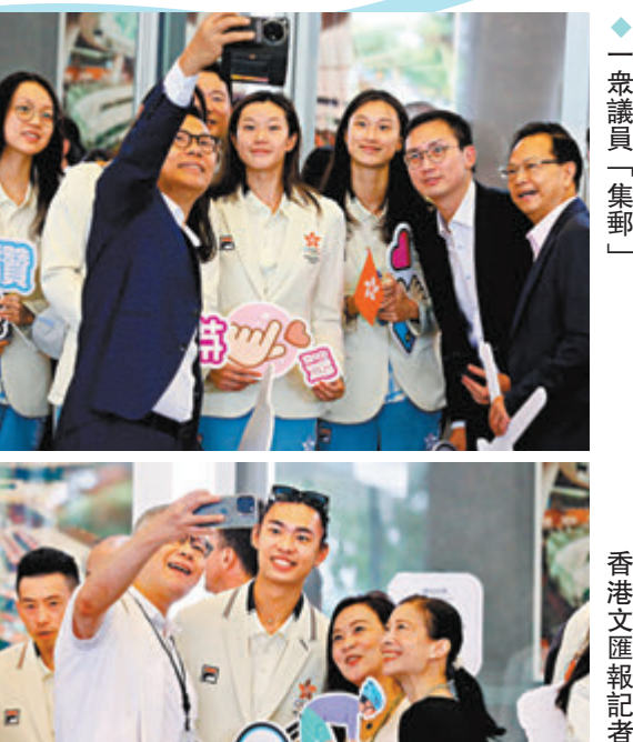
◆議員化身「粉絲」追星「集郵」。