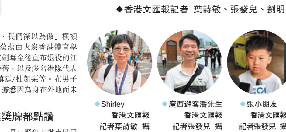
◆香港文匯報記者 葉詩敏、張發兒、劉明 ◆Shirley 香港文匯報記者葉詩敏 攝 ◆廣西遊客潘先生 香港文匯報記者張發兒 攝 ◆張小朋友 香港文匯報記者張發兒 攝