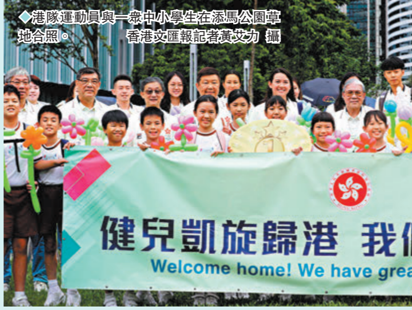
◆港隊運動員與一眾中小學生在添馬公園圍地合照。