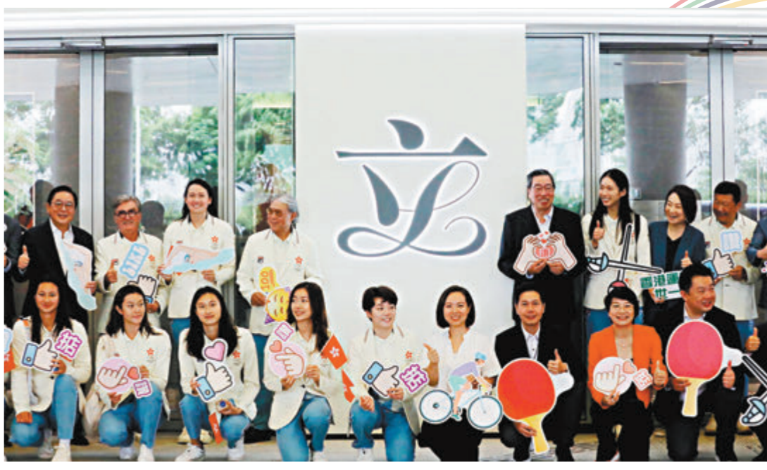
◆運動員與議員合影。