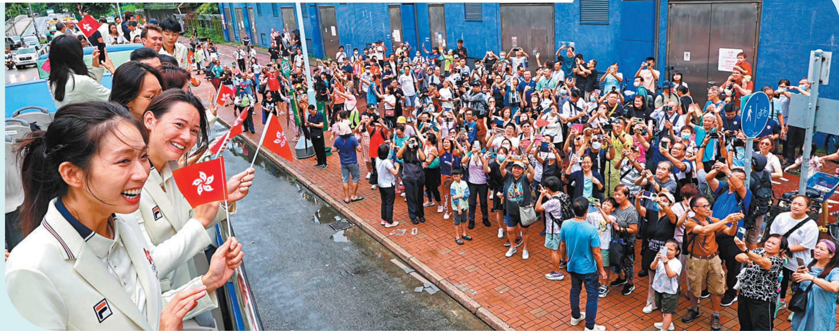
◆香港奧運健兒昨日乘敞篷巴士在多區巡遊，運動員向沿途夾道歡呼的市民揮手致意。