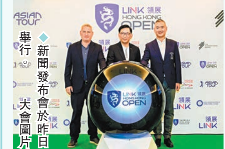
◆新聞發布會於昨日舉行。圖為領展與香港高爾夫球會代表合影。

香港文匯報訊 領展昨日宣布，由2024年起，連續3年冠名贊助「香港高爾夫球公開賽」，賽事現命名為「領展香港高爾夫球公開賽」。「領展香港高爾夫球公開賽」是亞洲歷史最悠久、最享負成名的高爾夫球錦標賽之一，第63屆賽事將於11月21日至24日在香港哥爾夫球會的粉嶺球場舉行。