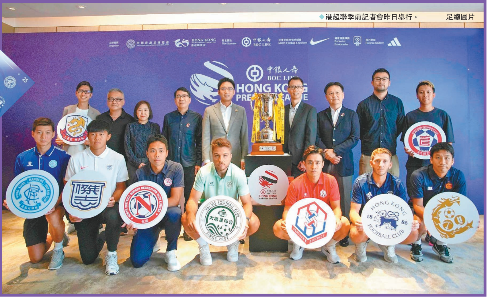
◆港超聯季前記者會昨日舉行。