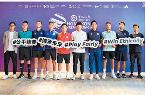
◆各港超球會均派員出席記者會。

新一季港超聯將於8月30日展開，東方標準流浪將於旺角大球場合演揭幕戰。足總主席霍啟山表示新球季除繼續提升本地賽吸引力外，更會致力於青訓發展，來季將首度成立U22聯賽，希望讓年輕球員有更多比賽機會：「好開心看到U22