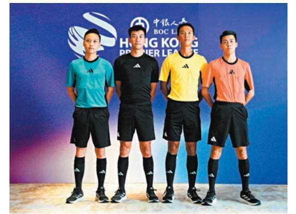
◆球證在今屆港超及足總盃都會有VAR協助執法。