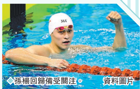
◆孫楊回歸備受關注。資料圖片