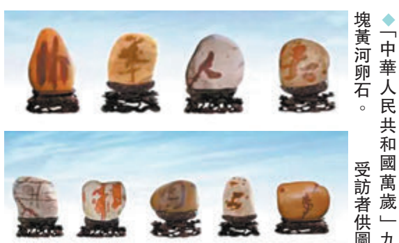
◆「中華人民共和國萬歲」九塊黃河卵石。