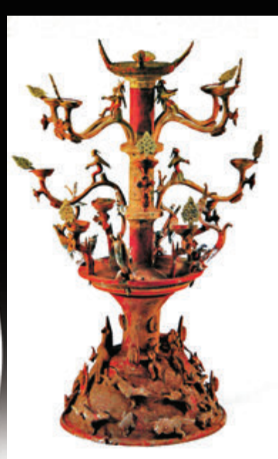
◆彩繪陶百花燈。 資料圖片

除了直觀的畫像和文字記載，此次展覽中一些融入文化元素和生活氣息，在現在看來依然都很「時尚」的文物，則展現了一個更加立體、形象的絲綢之路。