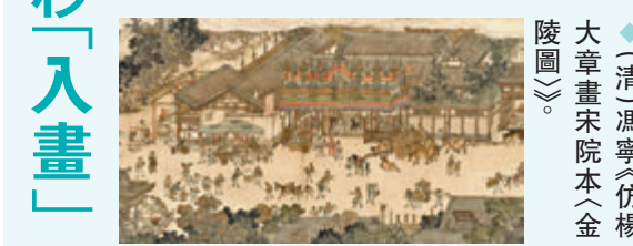
◆清馮寧《仿楊大章畫宋院本〈金陵圖〉》。

而「懸泉里簡」則詳細記載了從河西若干地區驛置道里的情況。陝西歷史博物館秦漢館工作人員表示，雖然兩塊簡出土於不同的地方，但在內容上卻完全銜接，形成一幅比較完整的從長安出發到敦煌的里程表。其殘存的簡文，也正好連接了這段從東至西的絲綢之路東段線路。