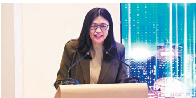
◆證監會行政總裁梁鳳儀表示，最新公布的季度數據一再證明證監會的策略方針見效。 資料圖片

香港文匯報訊（記者 岑健樂）香港財富管理中心地位穩固，證監會昨日公布的今年第二季多項數據指標都錄得增長。截至6月30日的季度，在香港註冊成立的基金的管理資產為14,924億元，較上季增加7.2%；季內錄得的淨資金流入約為591億元，較上季增加80.2%。在香港註冊成立的基金有944隻，較上季增加1.9%。