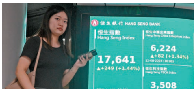
◆恒生指數昨升249點或1.44%。

另一方面，港股連跌兩日後 昨日反覆靠穩。恒指高開106點，雖然曾經倒跌1點，低見17,389點，但其後再度回