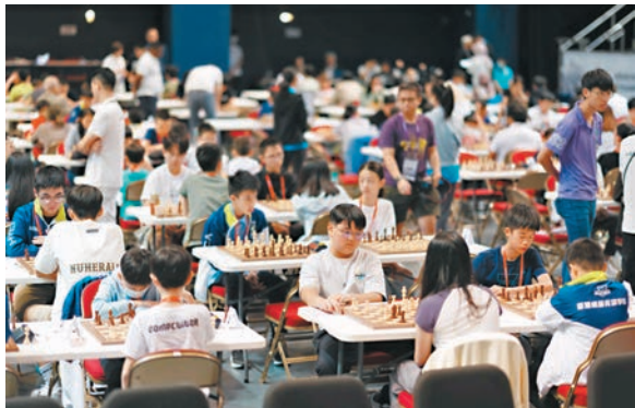
◆比賽在灣仔新伊館舉行，吸引來自多個亞洲國家及地區的選手參加。