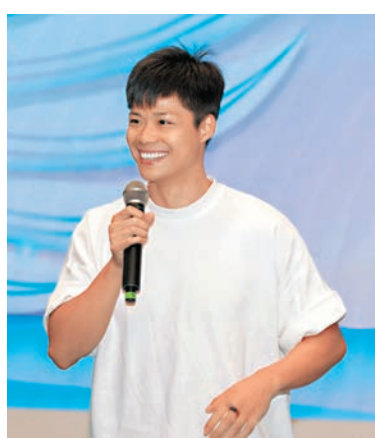
◆蘇炳添呼籲港澳台青年積極參與十五運志願工作。

此外，著名短跑運動員蘇炳添近日在2024年廣州市「百企千人」展翅計劃港澳大學生實習計劃結業禮上，分享自己的運動故事，並呼籲大灣區青年學子積極關注十五運，積極投身志願工作。他寄語港澳台青少年努力學習，攻堅克難，為粵港澳大灣區建設和體育強國事業貢獻青春力量。他倡議港澳台青年朋友們積極投身到十五運的籌備工作，「無論是作為參賽者還是志願者，都能用自己的方式為這次盛會增添光彩，營造全民健身、全民運動的全運氛圍。」