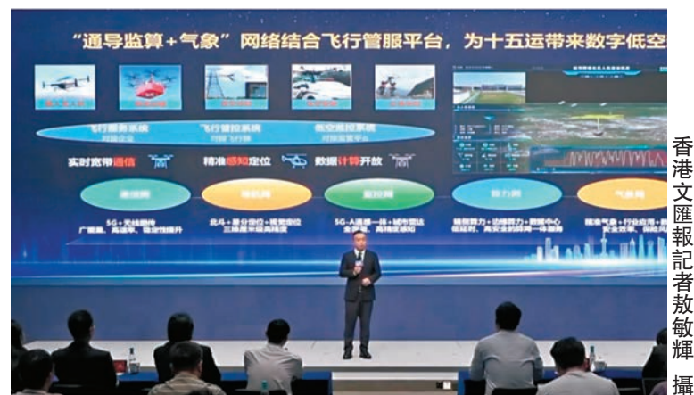
◆科技企業介紹面向十五運打造的數字技術應用方案。

香港文匯報訊(記者 敖敏輝 廣州報道)「我的廣州 我的十五運」數字技術企業迎全運會故事會」22日在廣州舉行，來自內地、香港的不同領域數字技術企業，圍繞通信技術支撐、賽事網絡安全、開閉幕式及場館數字展示技術等進行分享，介紹有望在十五運投入使用的數字技術和方案。記者從分享會上獲悉，有關企業正在研究融合數字人民幣功能的「萬能鑰匙」方案，助力運動員、裁判員等賽事相關群體在粵港便利參賽、工作、住宿、出行和消費。