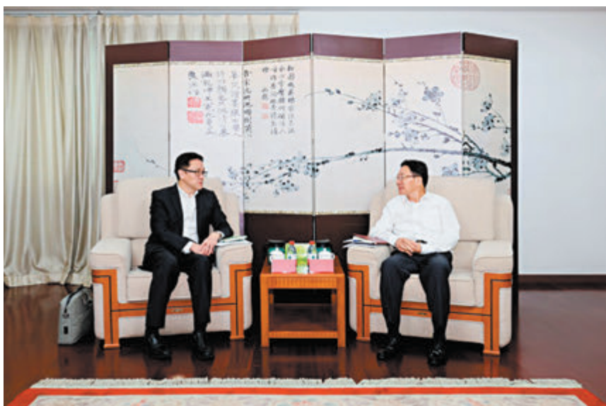
▲國務院港澳事務辦公室分管日常工作的副主任周霽在北京會見孫東一行。

孫東亦出席了HICOOL 2024全球創業者峰會開幕式暨全球創業大賽頒獎典禮，以及峰會晚宴。峰會期間，孫東與北京市領導、一眾當地的行業領軍人物、企業家與投資者交