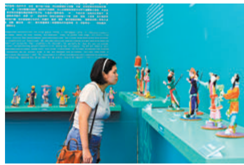
▲市民在抽紗公仔展區觀賞。

他介紹，在製作抽紗公仔前，必須先在腦海構思好塑像人物的性別、身形、動作，繼而用泥塑在抽紗公仔頭上作彩繪，固定臉譜樣式，從而表現人物的各種表情。「現時在香港掌握這項手藝的師傅已不多，如