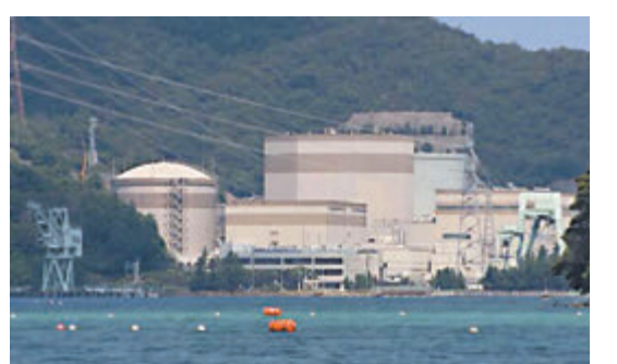
◆ 福井縣敦賀核電站將受放射性污染的碎布等廢棄物放入金屬容器中保管。

日本核電站近日零星事故頻發。就在前一天，日本東京電力公司計劃取出福島第一核電站2號機組反應堆堆芯燃料團塊，但由於取出裝置安裝錯誤，準備工作隨後暫停。此次計劃取出的核燃料團塊為數克，但插入回收裝置的5根管子的安裝順序出錯。據稱重啟工作將在周五以後，具體時間未定。