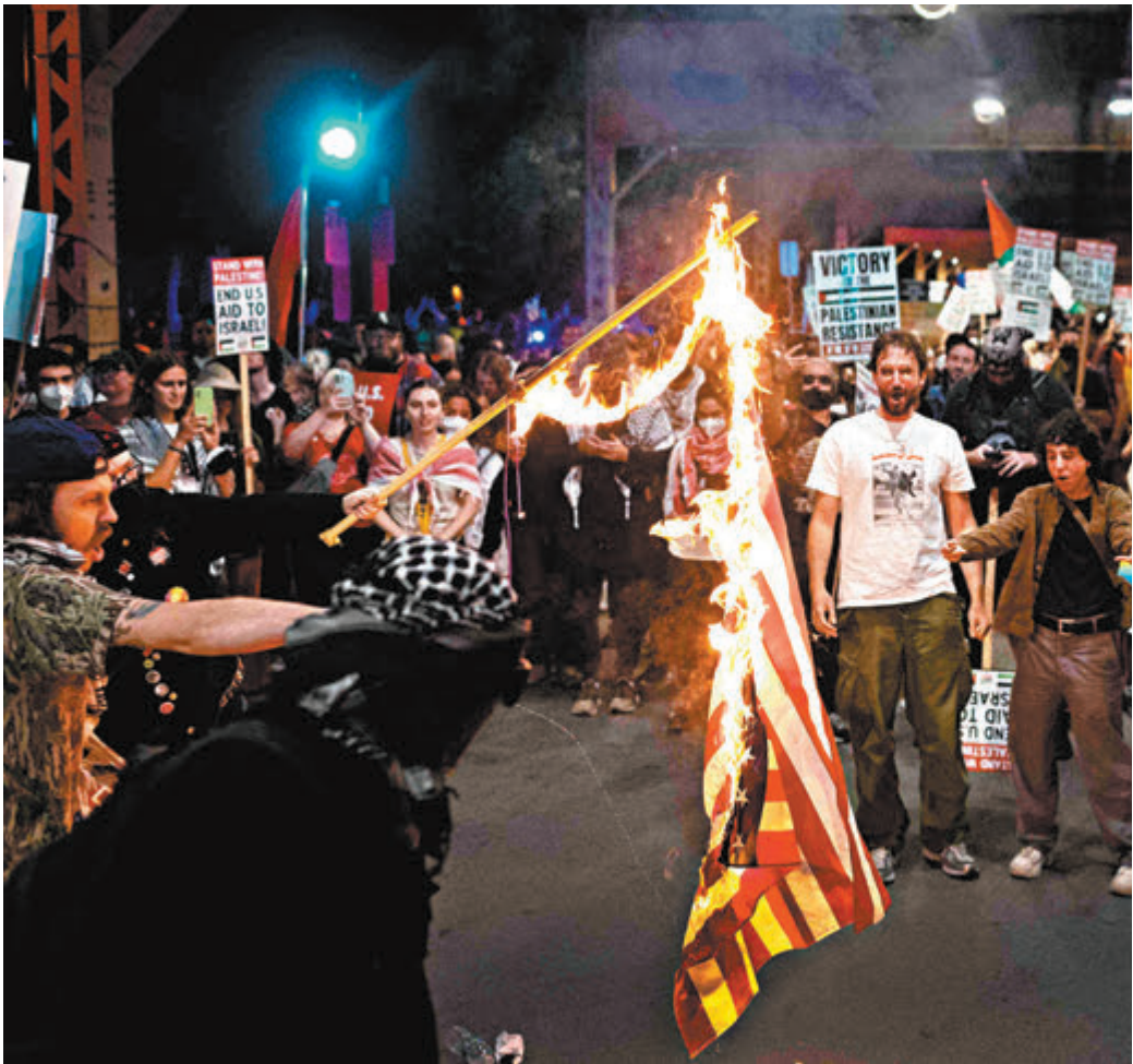
◆ 哈里斯刻意迴避加沙問題，被指加劇少數族裔社群失望情緒。圖為親巴支持者會在會場外焚燒美國國旗。

哈里斯接棒總統拜登出選以來，一直面臨呼聲要求闡述其外交政策。哈里斯在演說中稱，她會延續拜登的外交政策目標，「與烏克蘭和我們的北約盟友站在一起」。她還猛烈抨擊共和黨總統候選人特朗普，聲稱其「討好像(朝鮮領導人)金正恩這樣的『暴君』和『獨裁者』」，亦聲稱金正恩「支持」共和黨在11月大選中獲勝。