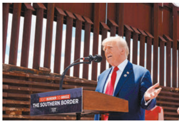
◆ 特朗普到亞利桑那州美墨邊境發表演說。

哈里斯強調自己願意彌補政治分歧，成為「所有美國人的總統」。在經濟政策和女性墮胎權等方面，她形容特朗普和共和黨陣營瘋狂、不顧美國普通民眾生計，「他只顧自己和那些億萬富豪朋友，會給他們新一輪減稅優惠。」