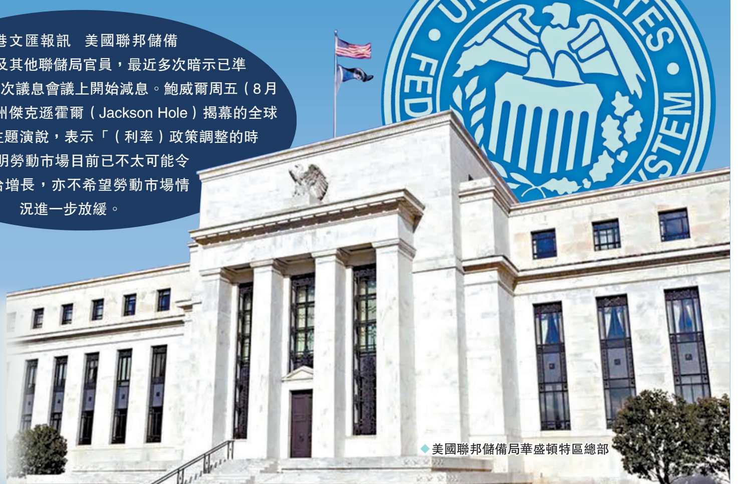
◆ 美國聯邦儲備局華盛頓特區總部

鮑威爾指出，利率政策推進的方向明確，減息的時機及步伐將取決於接下來的經濟數據、不斷變化的前景，以及風險的平衡。他表示美國經濟持續穩健成長，但目前通脹與就業市場的平衡已改變，通脹升溫風險已減弱，但就業市場下行風險有所增加，故現時將盡力支持勞動市場。聯儲局有充分理由認為通脹率將回落至2%，並同時保持強勁的勞動力市場。目前的政策利率水平，使局方有足夠的空間應對任何風險，包括勞動力市場狀況進一步疲弱的風險。