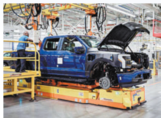
◆ 福特汽車放棄一款中大型電動SUV生產計劃。

香港文匯報訊 美國汽車產業似有意在新興電動車市場「打退堂鼓」。《華爾街日報》周五（8月23日）報道，作為美國車企代表的福特汽車，本周決定放棄前高調宣傳的一款中大型電動SUV生產計劃。分析認為美國消費者需求趨緩，令許多企業主動後撤，但行業高管多表示不會放棄該市場，需要維持與中國電動車製造商競爭。