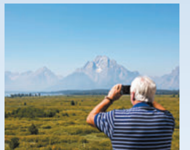
◆ 有與會者在傑克遜湖旅館拍照留影。

傑克遜霍爾在21世紀變得更重要，原因是聯儲局主席經常在此發表重大政策信息。現任主席鮑威爾2020年利用這次會議推出新的貨幣政策，翌年他闡述新一輪通脹可能會自行消退的原因。