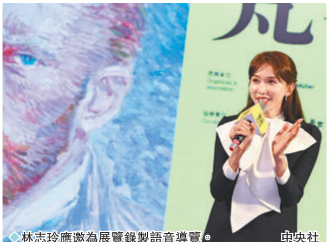
林志玲應邀為展覽錄製語音導覽。

記者問林志玲有沒有最喜歡的作品？她笑道：「那真的太多了！」她表示配音時光是閱讀文字，就感受到梵高的生命歷程，從創作初期的懵懂迷惘，到最輝煌的巔峰時期，以及後期內心的孤獨與惆悵，她比喻道：