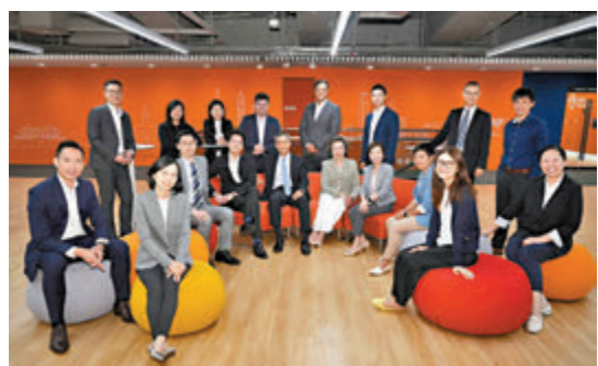
◆16名高級公務員將赴京開學。

她指出,北京大學是世界級頂尖學府,在多個世界大學排名中位列前茅,是不少國內外學者和