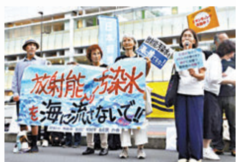
民眾在福島舉行抗議集會。

日本多地民眾周五在福島舉行抗議集會，反對核污水排海。「福島縣和平論壇」、「原子能資料