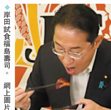
岸田試食福島壽司。

參加集會的日本民眾池田萬佐代表表示，自己強烈反對核污水排海。她說，日本強行啟動福島核污水排海是錯誤的，這顯示政府未將生命與安全放在第一位。應當立即停止核污水排海。