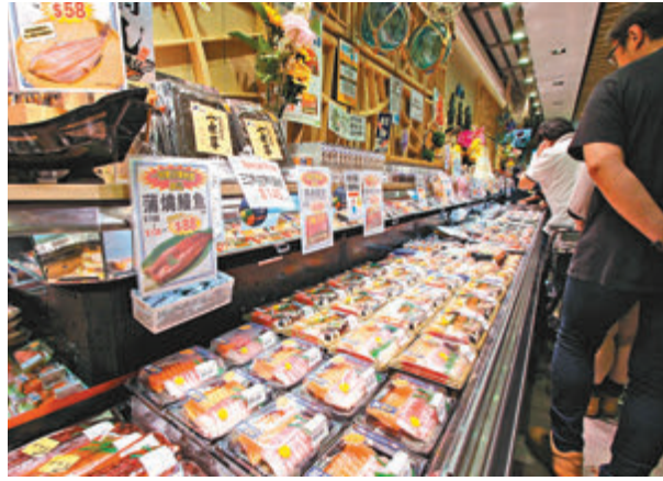
環境局重申有必要限制日本水產進口，如有需要或採取進一步措施。

取務實措施作預防是必要的，亦是科學的。環境及生態局強調，特區政府會繼續密切留意核污水排放的發展，包括日方及國際原子能機構的監察和科學數據等，進一步審視福島核污水排放對食物安全的影響，並會不時檢視相關應對措施。如發現情況惡化，不排除有需要採取進一步措施來加強保障香港食物安全。