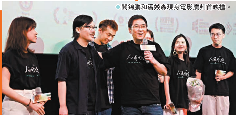
◆關錦鵬和潘燚森現身電影廣州首映禮。