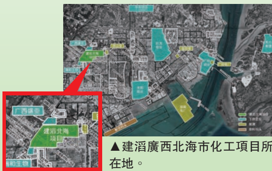
▲建滔廣西北海市化工項目所在地。

加強生態環境保護，推動發展方式綠色轉型仍是國家二零二四年的工作重點，化工部門將不遺餘力確保生產安全及排放達標。同時着力提升廠房效率，優化資源利用以降低能耗。集團於河北省邢台市籌建年產80萬噸的醋酸項目將於2024年年底投產，亦將採用清華大學環境學院開發的先進低能耗二氧化碳捕集技術。集團於廣西北海市籌建年產20萬噸的燒鹼項目將於2025年年底投產，於籌建的工業園區內已有足夠的客戶消化產能，所有燒鹼產品均可通過短途運輸或管道輸送節省運輸成本，而且燒鹼銷售均價相比衡陽地區每噸高出人民幣150至200元，市場優勢明顯。連同於廣東省惠州市大亞灣區年產45萬噸的苯酚丙酮項目已於2023年10月投產及年產24萬噸的雙酚A項目已於2024年6月投產，再加上以上位於河北及廣西的項目，集團於化工業務的版圖將進一步擴大。化工部門堅持以科技創新為引擎，推動企業轉型升級、綠色低碳高質量發展。