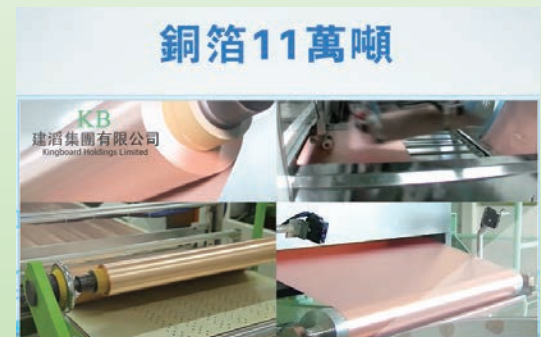
▲建滔每年生產銅箔逾11萬噸。

中央政府推行的提振電子產品需求的利好政策相繼落地，鼓勵和推動汽車、家電等消費品以舊換新。汽車電子化及智能化、AI行業持續高速發展以及高速網路不斷升級，均能刺激覆銅面板的需求，成為覆銅面板需求的主要增長動力。同時，集團大力打造覆銅面板研發中心，配備高精尖設備，集團已成功研發多種高頻高速產品可以應用於AI伺服器內的GPU主板，集團通過垂直產業鏈聯動發展，成功研發了應用於AI伺服器HVLP3銅箔、IC封裝載板用超薄VLP銅箔、210μm超薄低峰值銅箔、4.5μm錘電銅箔和2-3μm超薄載體銅箔。未來將能實現集團全方位覆蓋下游客戶的產品需求，並與優質客戶強強聯合，推動終端客戶對集團產品的認證。集團將於下半年於泰國增加覆銅面板產能每月40萬張，以配合海外客戶包括集團旗下印刷線路板部門海外業務的需求增長。