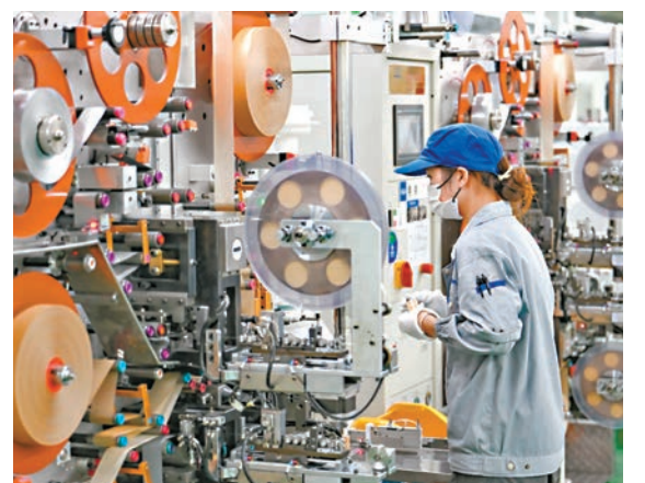
◆1-7月，企業所得稅同比下降5.4%。圖為江蘇南通一家企業內的生產景象。資料圖片