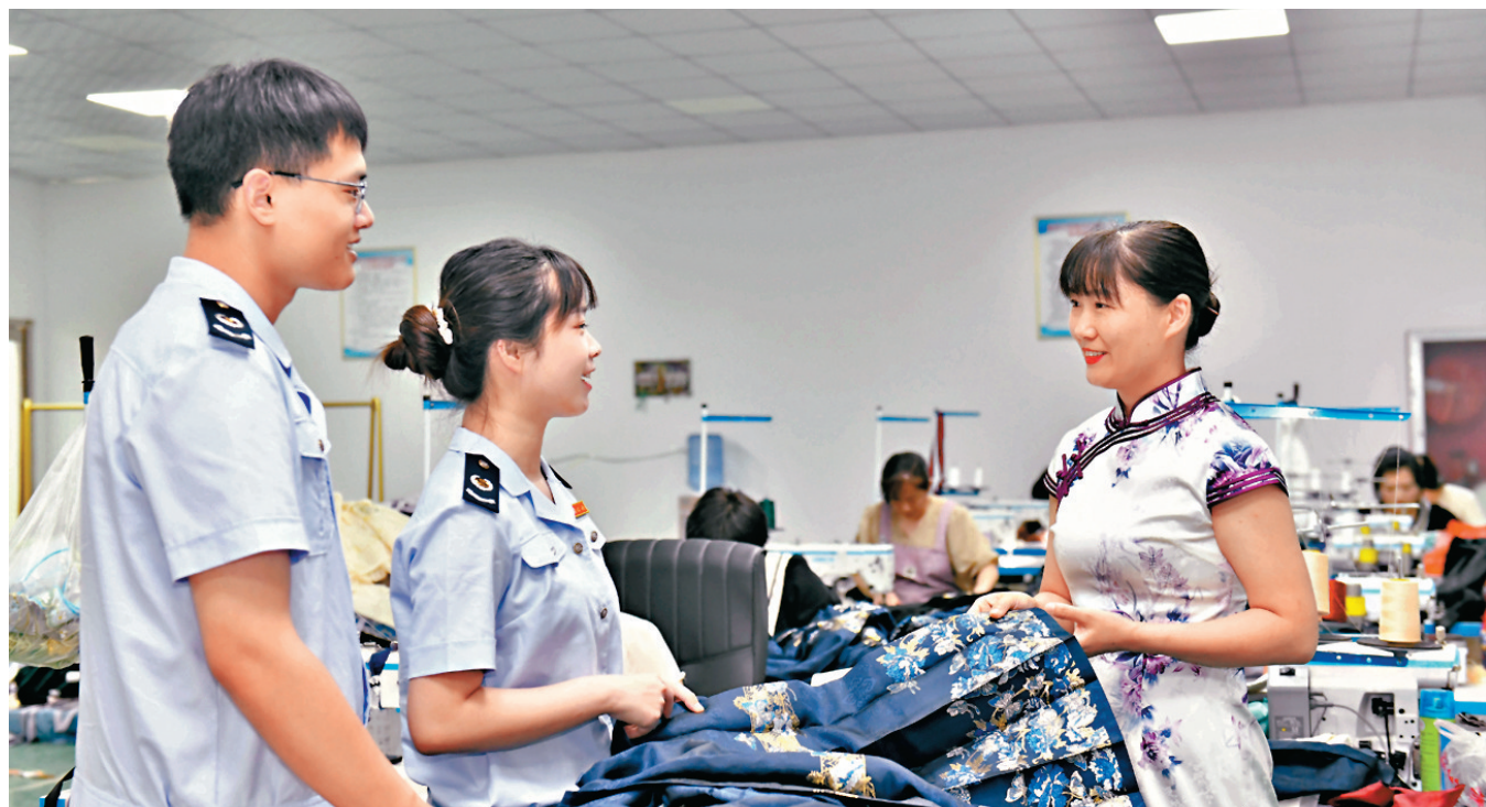
◆財政部強調，地方政府債務風險得到整體緩解，隱性債務規模逐步下降，目前地方政府債務風險總體可控。圖為早前山東曹縣稅務局的工作人員上門走訪，介紹減稅降費助企發展相關優惠政策。資料圖片

香港文匯報訊（記者 海巖 北京報道）上半年經濟增速有所放緩、物價水平持續低位等影響下，今年1-7月全國財政收入同比下降2.6%，7月當月財政收入同比下降1.9%，降幅略有收窄。財政部26日表示，後幾個月隨着宏觀政策落地見效，經濟回升向好態勢不斷鞏固，再加上減稅緩稅等特殊因素影響逐步消退，將對財政收入增長形成支撐。財政部還強調，地方政府債務風險得到整體緩解，隱性債務規模逐步下降，目前地方政府債務風險總體可控。