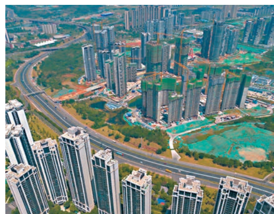
◆1-7月土地增值稅收入下降7.2%，折射房地產市場依然低迷。圖為成都天府新區。資料圖片

另外，今年1萬億元超長期特別國債也正計劃發行，疊加2.4萬億元新增債券待發行，市場普遍預計8月至11月將迎來發債高峰，將支撐財政支出穩步增長。