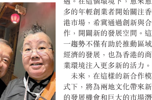
◆曾志偉與作者合照。

香港作為連接內地與國際市場的橋樑，為創業者提供了廣闊的視野和機遇。在這個環境下，愈來愈多的年輕創業者開始關注香港市場，希冀通過創新與合作，開闢新的發展空間。這一趨勢不僅有助於推動區域經濟的發展，也為香港的商業環境注入更多新的活力。未來，在這樣的新合作模式下，將為兩地文化帶來新的發展機遇和巨大的市場潛力，從而開啟一段嶄新的商業篇章。