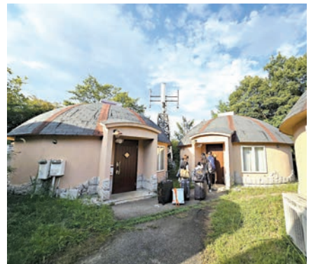
◆在親子農莊入住類似的蒙古包，孩子非常興奮！

昨天我們安全回港了，旅遊除了要點勇氣和運氣外，更要做好一切準備，包括入境處的24小時平安求助熱線(852) 1868。但願所有抓着暑期尾巴外遊的家庭平安喜樂，孩子和家長都帶着開心興奮的心情開學，好好享受新學年。