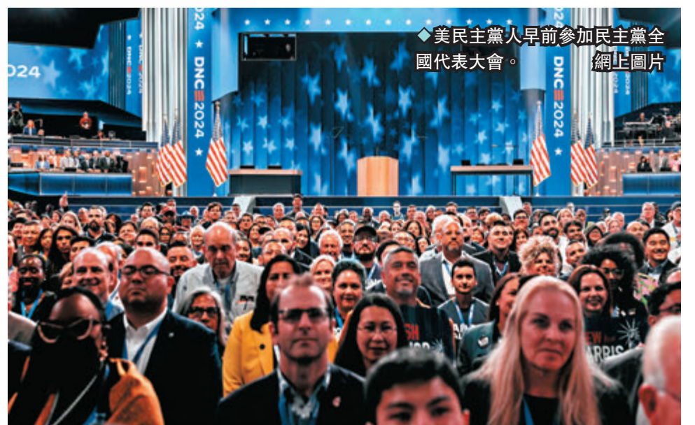
◆民主黨人早前參加民主黨全國代表大會。