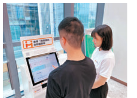
◆港方在珠海設置香港跨境通辦自助服務機及智方便自助登記站。

至於最多人使用的智方便功能，則是預訂康文署的場地，「最多一定是訂場，每日都有，交稅都很受歡迎，但不會一年不停地交稅，另外申請一些津貼例如在職家庭津貼、學費津貼