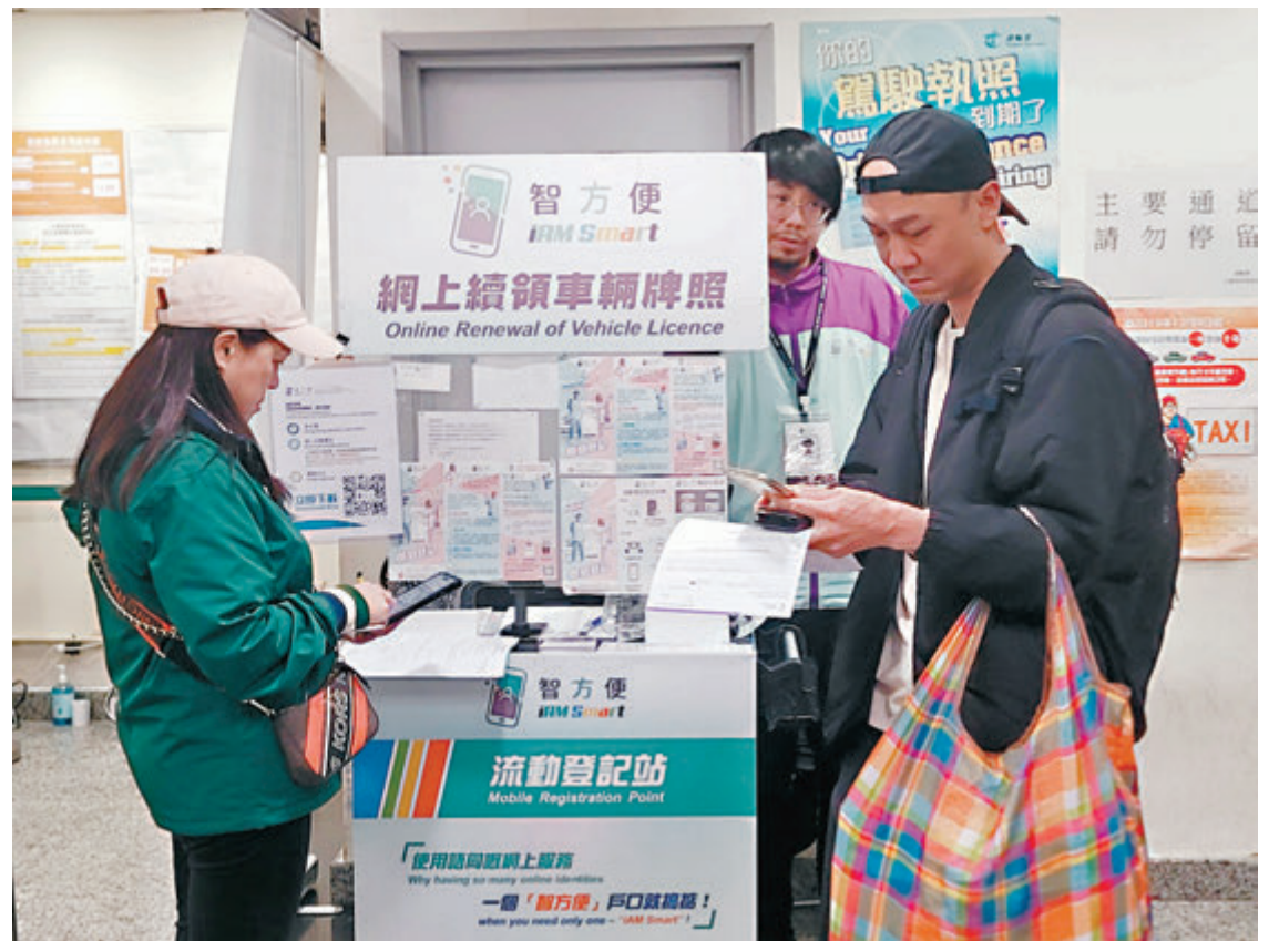
▲智方便流動登記站。