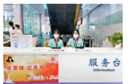
◆港方在廣州設置智方便登記服務櫃位。